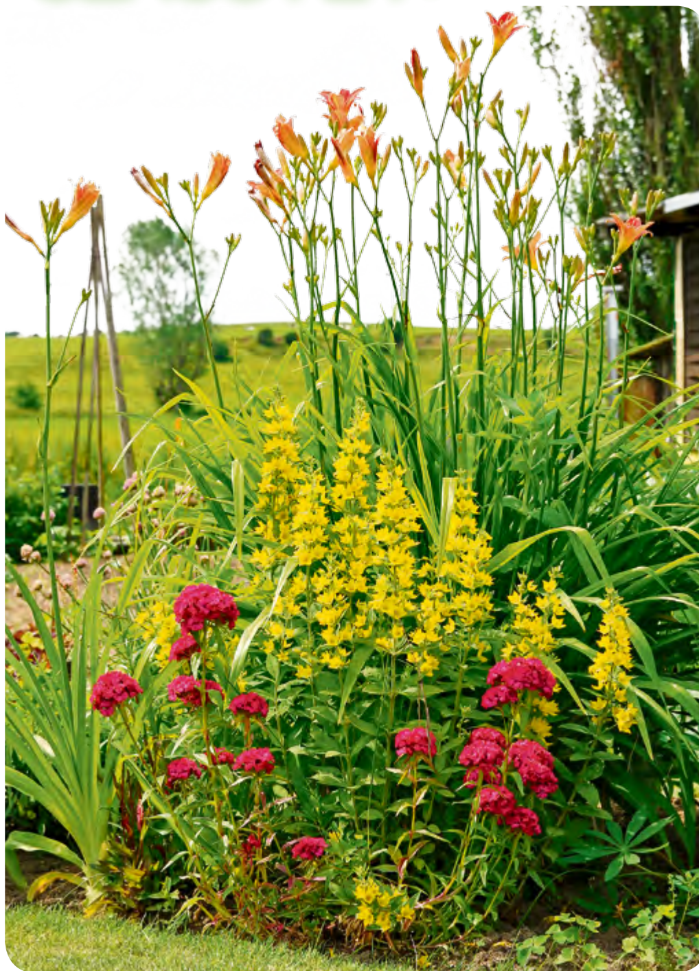
Die hoch aufragende Taglilie kommt mit wenig Wasser aus, ist mit frischem Grün ein Frühstarter im Gartenjahr und besticht ab Ende Juni viele Wochen mit ihren leuchtenden orangefarbenen Blüten.

Wer nicht auf durstige Hortensien, Rhododendren oder Phloxe verzichten möchte, für den könnten automatische Bewässerungsanlagen eine gute Idee sein.