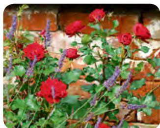
Lavendel liebt Sonne und kommt mit Trockenheit klar.