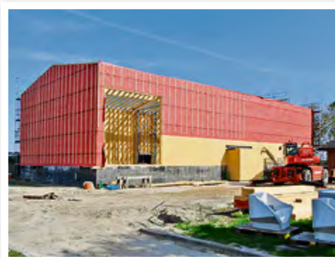
... entstand auf den Fundamenten die neue Halle.