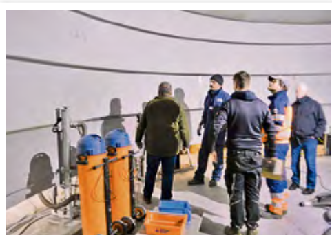
Die Edelstahlbahnen werden hier verschweißt, ...