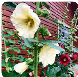
Pfahlwurzler wie Malven erreichen tieferes Wasser.

Dazu zählen zum Beispiel Taglilien ( Hemerocallis ) oder der Sonnenhut ( Echinacea ). Duftend überzeugt der wärmeliebende Lavendel ( Lavandula angustifolia ). Weniger bekannt, aber ebenfalls herrlich aromatisch, ist die Fiederschnittige Blauraute ( Perovskia abrotanoides ). Stauden und Ziergräser aus Steppenregionen dürften sich auch bei uns wohlfühlen. Tiefwurzler sind besser gegen Trockenheit gewappnet, weil sie tiefergelegene Wasservorräte erreichen.