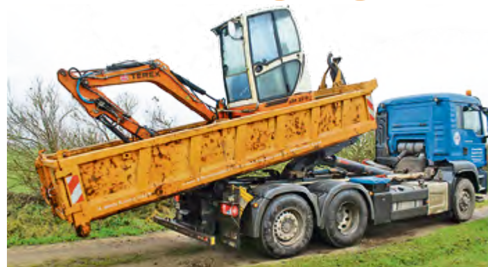
In diesem Jahr soll ein Muldtkipper angeschafft werden und die Arbeit der Rohrleitungsbauer vereinfachen. Flexibler und unabhängig ist das Team dann im Einsatz.