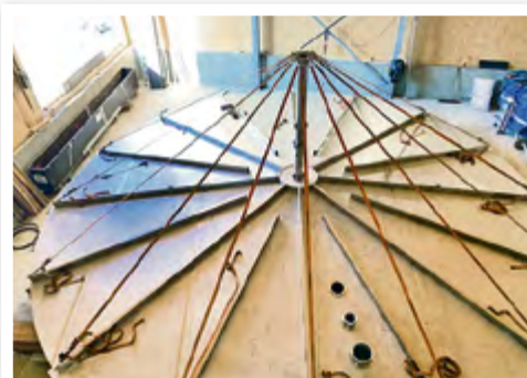
... der Behälter wächst so stetig in die Höhe.