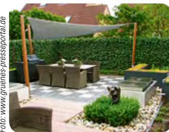
Schatten unterm luftigen Sonnensegel.

Über Terrassen und Balkons empfiehlt sich ein großes Sonnensegel. Luftig