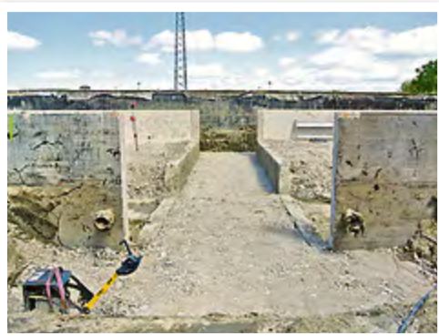
Die alten Behälter wurden erst abgerissen, dann ...

Die nächste Frage lautete: sanieren oder neu bauen? Wirtschaftliche Berechnungen gaben den Ausschlag für den Neubau. Vor etwa einem Jahr ging es mit Abrissarbeiten am alten Standort los. Schließlich sollte dort Platz geschaffen werden für die Nachfolger. Erst entstand auf dem Fundament der Vorgänger eine große Halle, die später die eigentlichen Behälter schützt. In diesem Februar ging es mit deren Bau los. Bahn für Bahn werden sie verschweißt und damit Stück für Stück in die Höhe gehoben. Diese Methode hat schon in Harrislee sehr gut funktioniert und sich dort bewährt. Für Juni ist nach gründlicher Beprobung die Inbetriebnahme geplant. Das Trinkwasser bekommt dann also einen schönen Empfang auf Pellworm.