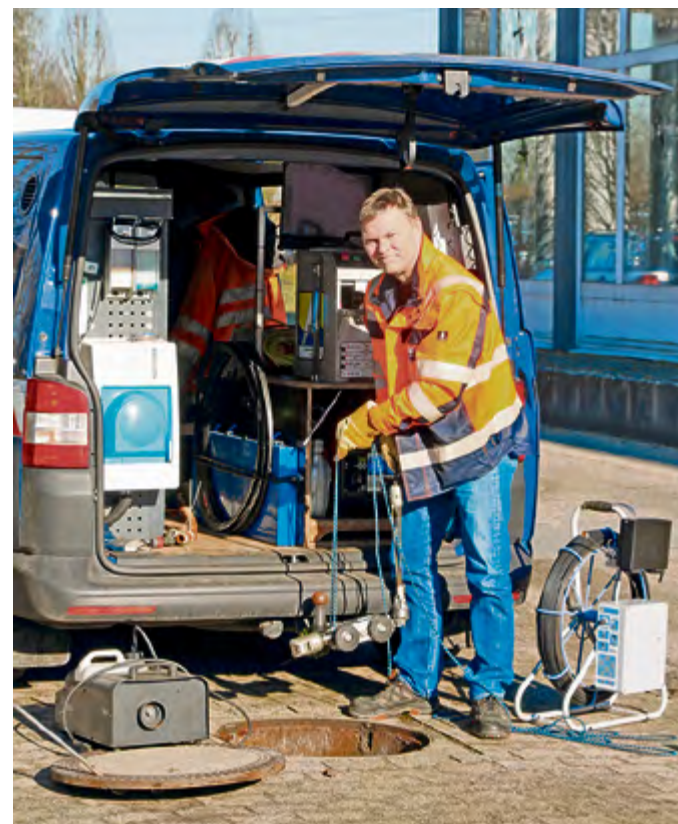
Im gereinigten Abwasserkanal deckt die Kamera Unregelmäßigkeiten an Leitung und Anschlüssen auf.

Der richtige Weg sei, das Kellerwasser bestenfalls im Garten zu versickern. „In Ausnahmefällen kann es in Abstimmung mit uns in den Regenwasseranschluss oder übergangsweise auf die Straße gepumpt werden“, zeigt er Lösungen auf. „Kommen Sie am besten mit uns ins Gespräch“, legt er betroffenen Kunden ans Herz. Bei hohem Grundwasserstand ist der sicherste Weg, die Keller professionell abzudichten.