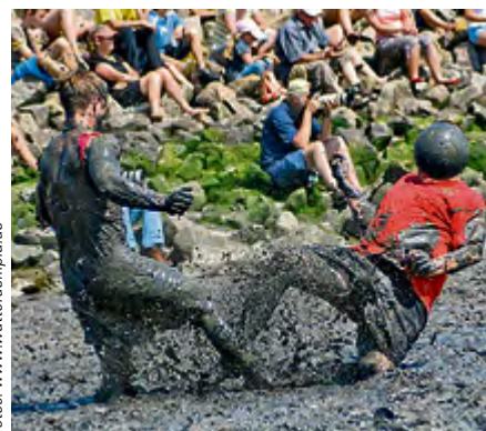
Die einhellige Meinung der Gäste zum Matschspektakel – ganz schön anzuschauen.