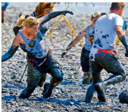
Fuß- oder Handball und das knietief im Matsch – ganz schön anstrengend.

„Stark gegen Krebs – Wattolümpiade e. V.“ Sparkasse Westholstein IBAN: DE 27 2225 0020 0185 0096 37 BIC: NOLADE21WHO