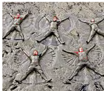
Die 350 Schlick-Engel im Jahr 2014 – ganz schön Weltrekord-verdächtig.